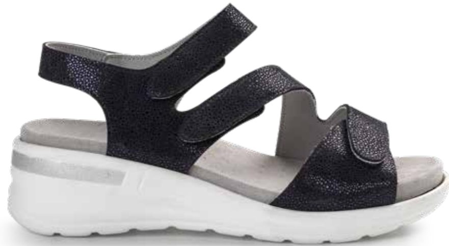
5116/ AZUL OSCURO (PIEL)