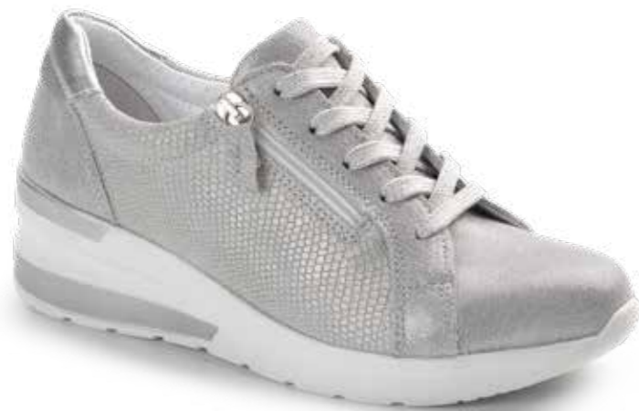
5113/ HIELO (PIEL + LICRA)