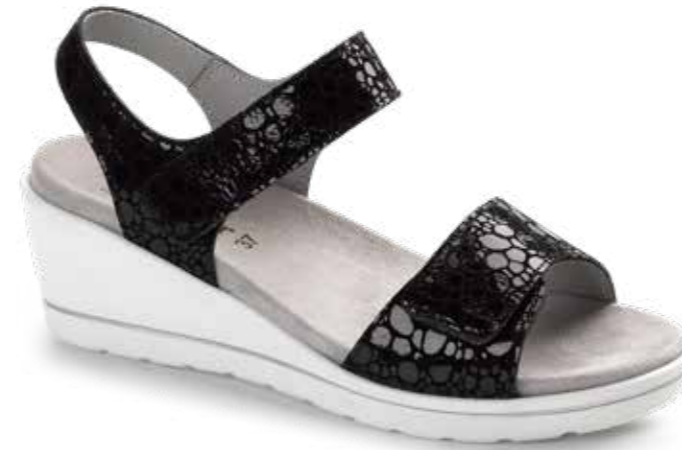
5117/ NEGRO (PIEL)