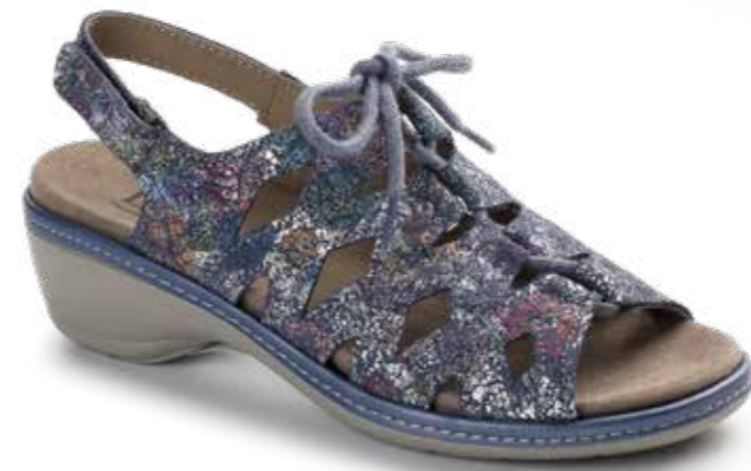
5100F/ FANTASIA (PIEL GRABADA)