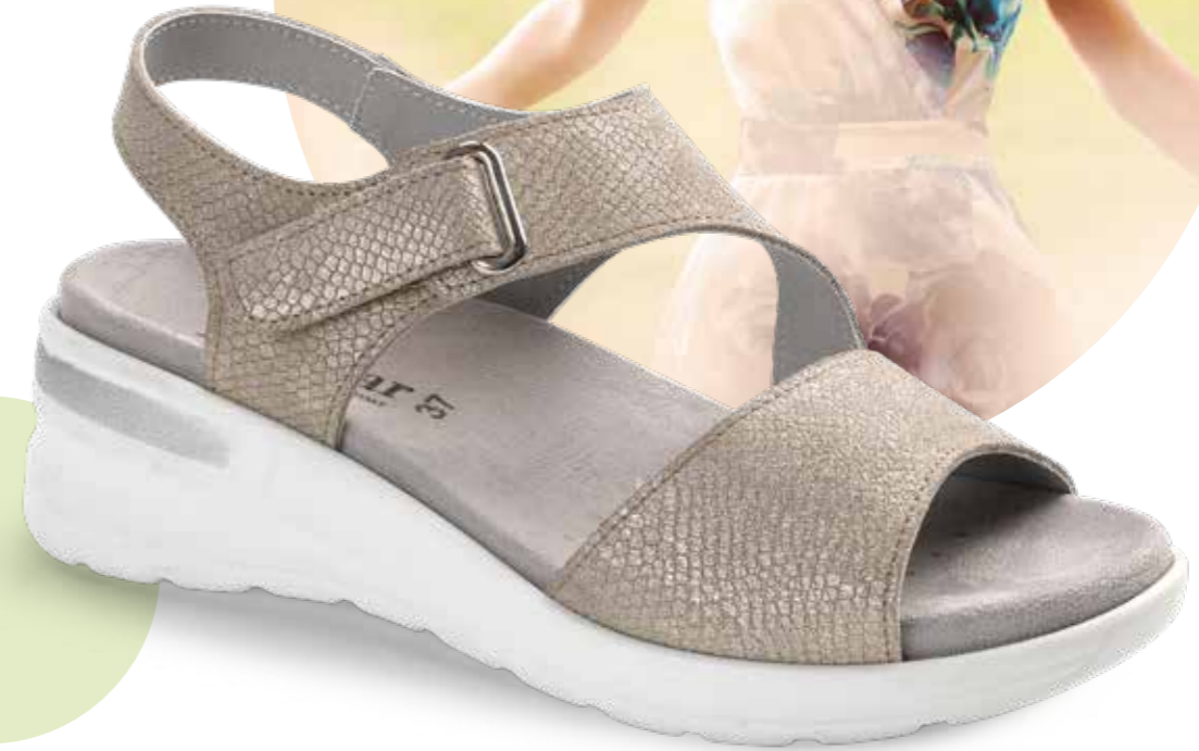
5115/ CHAMPAN (PIEL)