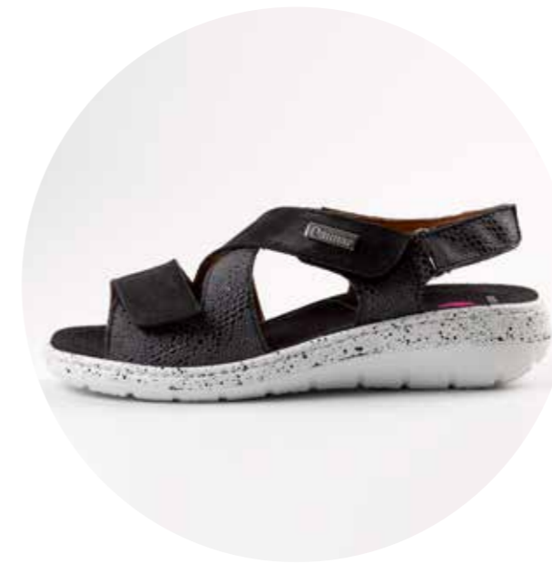
5106-N/ NEGRO (RODABALHO + PIEL)