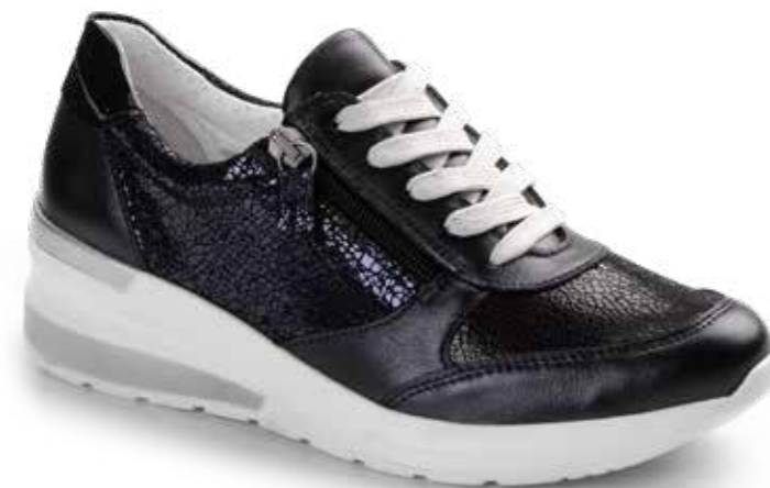
5114/ AZUL (PIEL + LICRA)