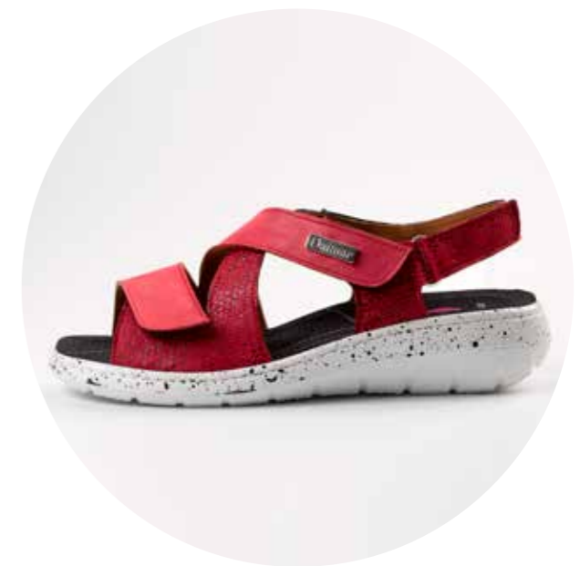
5106-P/ GRANATE (RODABALHO + PIEL)